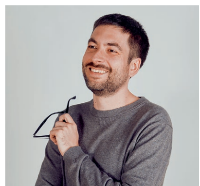
Philipp Müller Architekt